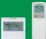
ขึ้นอยู่กับรุ่นที่เลือก