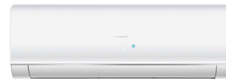
HSU-10VFA03T HSU-13VFA03T HSU-18VFA03T1 HSU-24VFA03T1