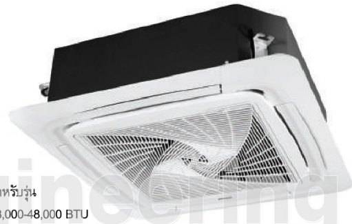
สำหรับรุ่น 18,000-48,000 BTU