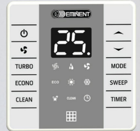
รีโมทคอนโทรลแบบมีสาย

*แบบไร้สายสามารถเชื่อมต่อ WiFi ได้โดยเชื่อมต่อผ่าน Eminent Air Application เพื่อสั่งการผ่านระบบ WiFi ได้