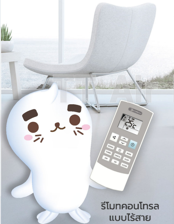
รีโมทคอนโทรลแบบไร้สาย

ประหยัดไฟเบอร์ 5 ค่า SEER สูงถึง 23.11 (ในขนาด 37,000 BTU) เบอร์ 5 ระดับ 3 ดาว ในขนาด 31,000 และ 37,000 BTU