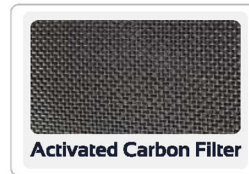
Activated Carbon Filter