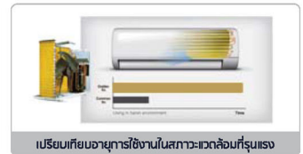
เปรียบเทียบอายุการใช้งานในสภาวะแวดล้อมที่รุนแรง

แผงคอยล์เย็นและคอยล์ร้อนแบบ Golden Fin มีประสิทธิภาพในการระบายความเย็นและความร้อนได้ดี ทำให้เพิ่มประสิทธิภาพการไหลเวียนของสารทำความเย็น มีคุณสมบัติช่วยยืดอายุการใช้งานเครื่องปรับอากาศ สามารถทนต่อฝนกรด ช่วยป้องกันการกัดกร่อนของโอเค็มบริเวณชายทะเลและสารเคมีที่มีฤทธิ์กัดกร่อนอื่นๆ ในย่านโรงงานอุตสาหกรรม ได้มากยิ่งขึ้น