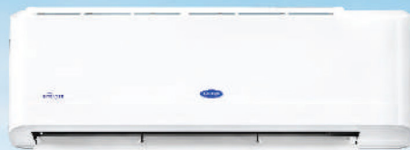
รุ่น 42TEVGB024-703 รุ่น 42TEVGB028-703