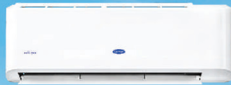
รุ่น 42TEVGB013-703 รุ่น 42TEVGB018-703