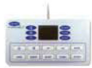
รีโมทมีสาย แบบมีตัวเลขใช้วอลุ่มทุกมี