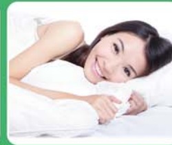
ควบคุมความชื้น เย็นสบาย ไม่รู้สึกเหนียวตัว