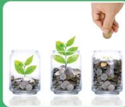
ประหยัดไฟ SEER สูงสุด 26.05