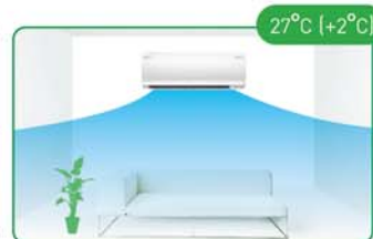
ประหยัดพลังงานเมื่อไม่มีคนอยู่ (ปรับเพิ่มอุณหภูมิ +2°C)