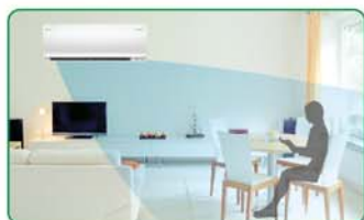
กระจายลมที่คนโดยตรง*

พัฒนาขึ้นไปอีกขั้นกับฟังก์ชันใหม่ของตาอัจฉริยะ-ตรวจจับการเคลื่อนไหวของคนภายในห้อง และเลือกการกระจายลมได้ตามความต้องการของคุณ