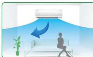
กระจายลมเลี่ยงไม่โดนตัว*